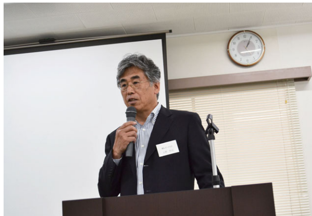
挨拶する上野会長