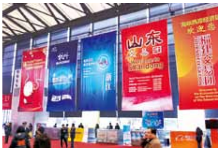
上海市をはじめ3市6省の企業3500社が出展