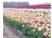
今期国内初登場！珍しい斑入葉チュウリップ ハッピーアップスター

〒959-2624 新潟県胎内市羽黒 1351-1 株式会社ガーデンプラザ・ナガバ TEL 0254-43-6848 FAX 0254-43-6543