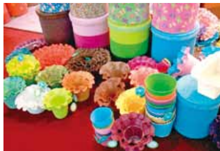
カラフルな容器や家庭用品が数多く出展されている （素材はペーパー、プラスチック、レザーなど多様）